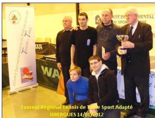
Tournoi Régional Tennis de Table Sport Adapté ISBERGUES 14/01/2012