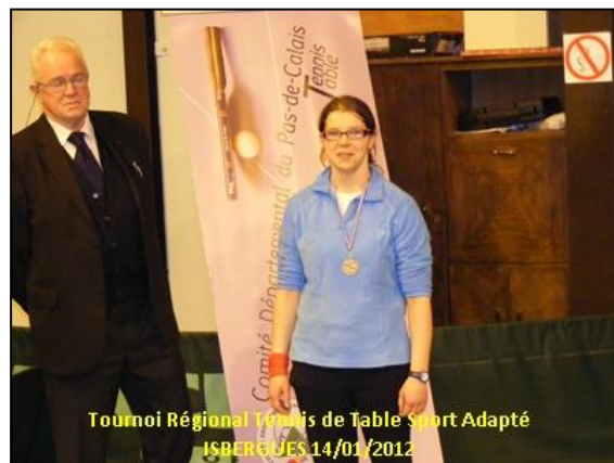
Tournoi Régional Tennis de Table Sport Adapté ISBERGUES 14/01/2012