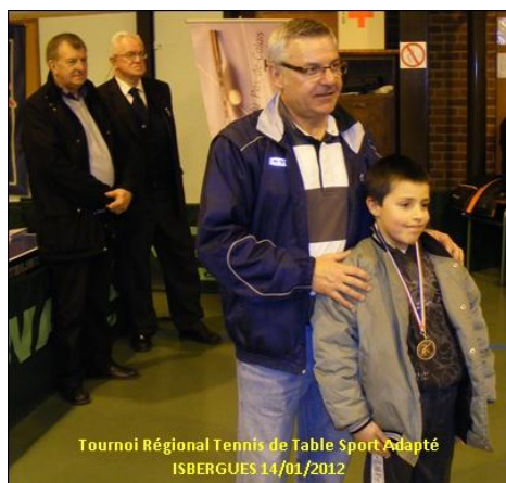
Tournoi Régional Tennis de Table Sport Adapté ISBERGUES 14/01/2012